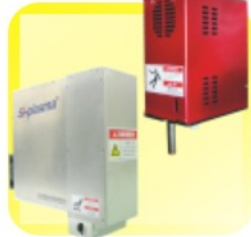
SAP009T、SAP009SA 常压等离子清洁模组