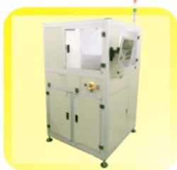
RPA12 RIE 等离子蚀刻机