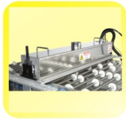
SAP006 宽幅式 常压等离子模组