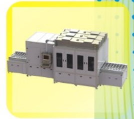
指纹识别晶片 有色精密涂布机