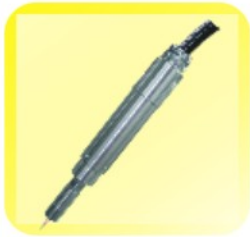
SAP003 点状式 常压等离子模组