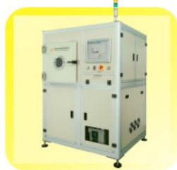
PC03 / PC04 低压等离子清洁设备