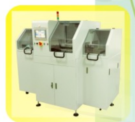
IPC04 In-line 等离子清洁设备