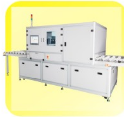
AP PVD01C37 抗污膜 / 抗指纹膜 常压蒸镀机