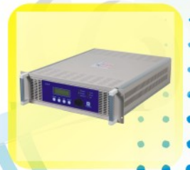
等离子电源供应器